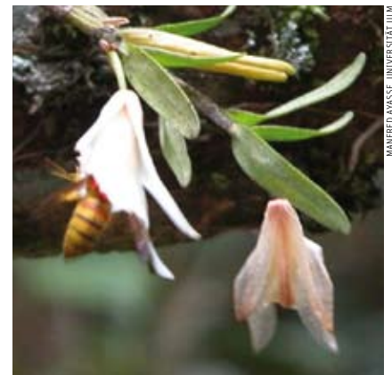
Nicht Nektar ist es, der die Hornisse Vespa bicolor in den Blütenkelch der Orchidee lockt, sondern die Aussicht, eine Biene zu erbeuten.

■ Orchideen sind nicht nur schön anzusehen, sondern auch sehr raffiniert, wenn es darum geht, sich fortzupflanzen. Viele von ihnen verfügen nicht über Nektar und sind daher für potenzielle Bestäuber uninteressant. Deshalb verlegen sie sich aufs Täuschen. So ahmen manche die Form von Insektenweibchen nach und nutzen die Paarungsversuche liebeshungriger Männchen zum Übertragen der Pollen. Andere verströmen den Geruch von nektarreichen Blumen und locken so Insekten an. Auf einen besonderen Trick ist nach jüngsten Untersuchungen eine asiatische Orchideenart verfallen: Sie produziert das Alarmpheromon von Bienen, um sich von Hornissen bestäuben zu lassen.