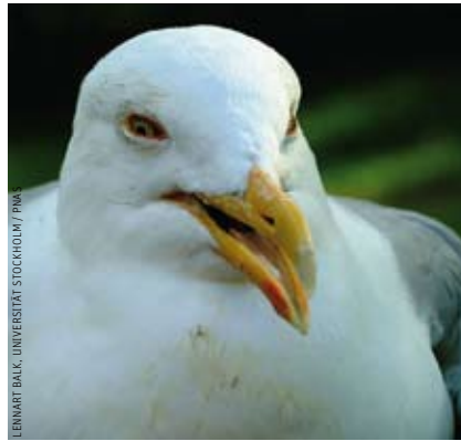
Silbermöwe mit ersten Anzeichen eines Vitamin-B1-Mangels: Sie hat Schwierigkeiten, die Flügel anzulegen, und zeigt eine Verfärbung der Iris.