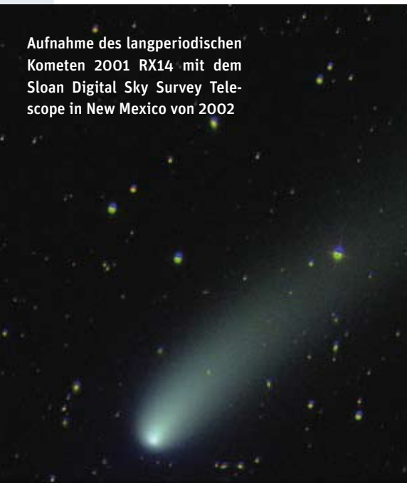
Aufnahme des langperiodischen Kometen 2001 RX14 mit dem Sloan Digital Sky Survey Telescope in New Mexico von 2002